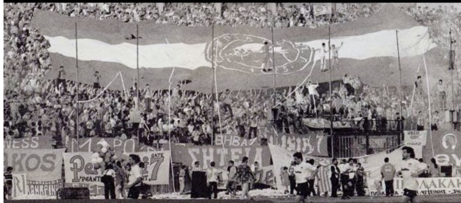
Θύρα 7, 8.2.1981. "Αδέλφια ζείτε εσείς μας οδηγείτε".