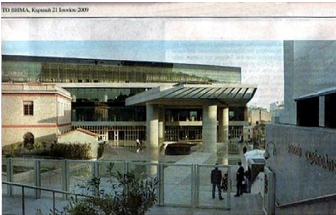
Εξωτερική όψη του νέου Μουσείου της Ακρόπολης που εγκαινιάστηκε χτες

Τον Ιούνιο του 2009, μεγάλες εφημερίδες, όπως το «Βήμα», η «Ελευθεροτυπία» και το «Έθνος», «πληροφορούσαν» τους Έλληνες πολίτες, πως στην Αθήνα, η «ωριαία» συνάντηση Καραμανλή και Ερντογάν, διεξήχθη σε «ψυχρό κλίμα», παρά τα «χαμόγελα». Για κακή τους τύχη όμως, το κλίμα που ήταν στραβό, το έφαγε κι ο γάιδαρος, καθώς ο Τούρκος πρωθυπουργός, ανέβαλε την επίσκεψή του στην Ελλάδα. Επειδή η επίσκεψη θα γινόταν ημέρα Σάββατο βράδυ και οι εφημερίδες κλείνουν πιο νωρίς τη μέρα αυτή, οι δημοσιογράφοι δεν πτοήθηκαν και επινόησαν αυτά τα ευφάνταστα «ρεπορτάζ», τα οποία τελικά τους εξέθεσαν, ως προς την αξιοπιστία τους.