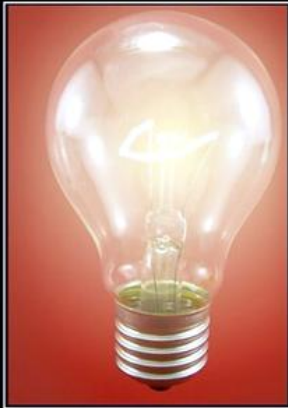
Αυτό είναι φως.