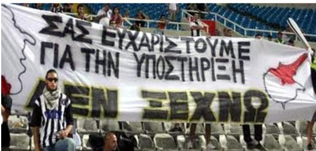
Σύνθημα, στο στάδιο «Πετρόβσκι» της ομάδος Ζενίτ, στη Ρωσία...