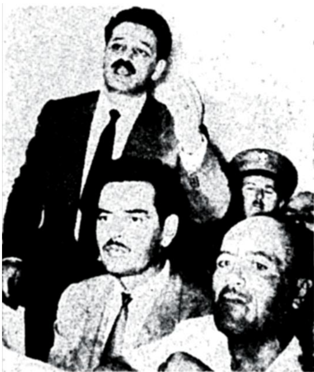
Ο κατηγορούμενος διευθυντής της «Αύγης», Έμμ. Γλέζος, όπανά εις ερώτησιν τού πρέδρου.

Κινητοποιήθηκε τότε ολόκληρο το Παραπέτασμα και στις κομμουνιστικές χώρες, με κύριο ενορχηστρωτή την Σοβιετική Ένωση, έγιναν διάφορες «αυθόρμητες» εκδηλώσεις συμπαράστασης στον Μανώλη Γλέζο (αυτό που σήμερα κάποιοι ονομάζουν «διεθνή κατακραυγή»), ενώ κάποιοι ηγέτες, όπως ο πρόεδρος της Σοβιετικής Ένωσης, Κλίμεντ Βοροσίλοφ, έστειλαν εκκλήσεις για απελευθέρωση του Γλέζου, διότι «η κοινή γνώμη τής Σοβιετικής Ενώσεως εκδηλοί βαθείαν ανησυχίαν διά την τύχην τού Έλληνος προοδευτικού δημοσίου παράγοντος, τού εθνικού ήρωος τής Ελλάδος Εμμανουήλ Γλέζου, η ζωή και η ελευθερία τού οποίου απειλούνται». Οι εκκλήσεις αυτές απορρίφθηκαν ως απαράδεκτες και ως ωμή