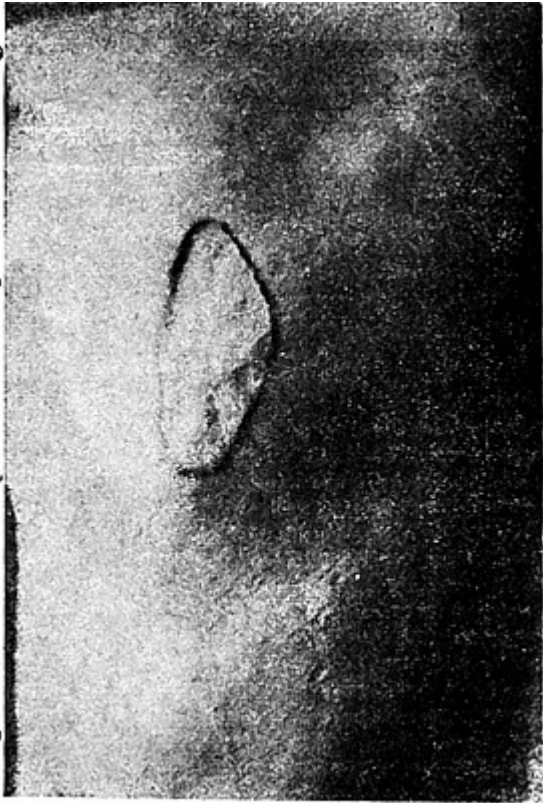
Ο αμφοσταγής ΒΕΛΟΥΧΙΩΤΗΣ, με άρπάζει από τὰ μαλλιά καὶ μου κολάει τὸ καυτό σίδηρο στὴν ἀριστερὴ μεριά τῆς πλάτης μου! Τὸ σημάδι διατηρεῖται βαθύ μέχρι σήμερα.